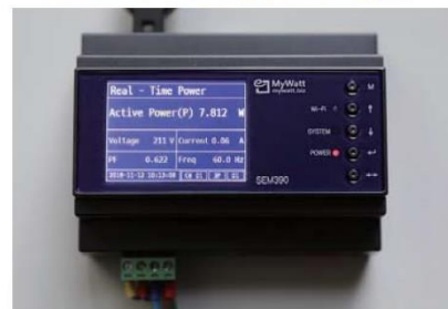
SEM370 Rail Mounting Smart Energy Manager