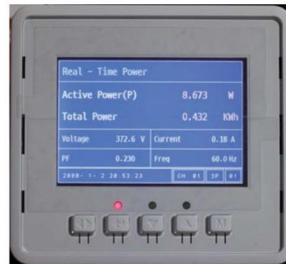
SEM390/SEM392 4-Channel Smart Energy Manager (12 Clamp)